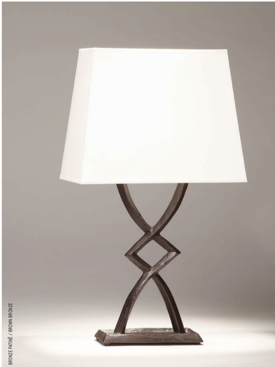
BRONZE PATINÉ / BROWN BRONZE