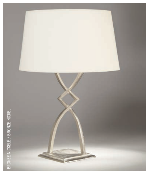
BRONZE NICKELÉ / BRONZE NICKEL