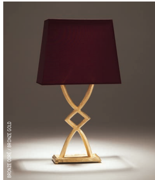
BRONZE DORÉ / BRONZE GOLD