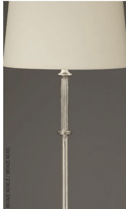
BRONZE NICKELÉ / BRONZE NICKEL