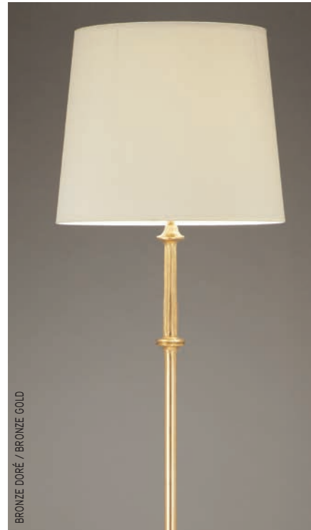
BRONZE DORÉ / BRONZE GOLD