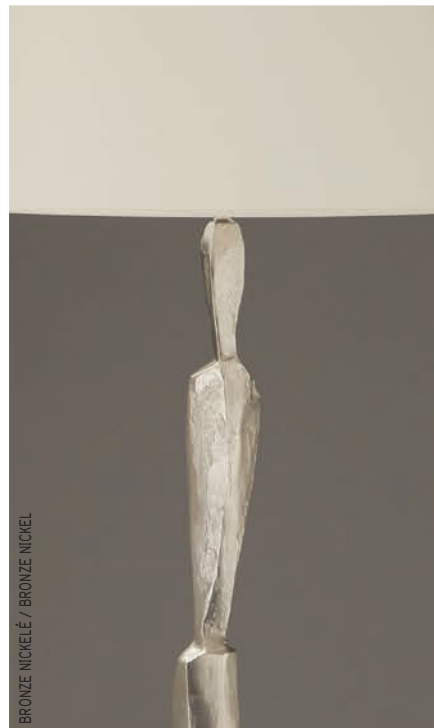
BRONZE NICKELÉ / BRONZE NICKEL